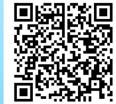
参加申し込みQRコード